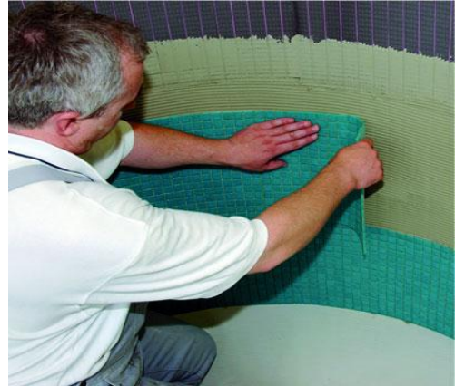
Ronde en gekromde ondergrondconstructies, met PCI PECIDUR CREATIV platen zijn er vele mogelijkheden.